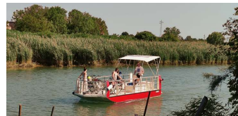
Boottocht over de lagune