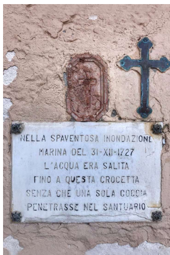
Het kruis geeft het waterpeil aan van de overstroming in 1727. De kerk bleef droog

de moeite waard. Hier kun je de bijna 1000 jaar oude kerk bewonderen en de aangrenzende bijzondere cilindrisch vormige klokkentoren beklimmen. Deze 48 meter hoge toren met kegelvormig dak was ooit een wachttoren en de architectonische invloeden uit het dichtbij gelegen Byzantijnse Ravenna zijn hierin duidelijk terug te zien.