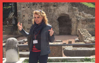
Elbrich aan het werk