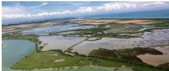
De Lagune van Caorle: hier is van alles te doen

de vissers er zelfs maandenlang met hun hele gezin. Gedurende deze meest visvangstrijke periode die framma wordt genoemd, werd de vis gevangen die in de herfst vanuit de lagunebekkens naar zee zwom. De lagune en casoni van Caorle zijn een magisch gebied waar de tijd lijkt te hebben stilgestaan, je kunt er even