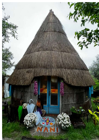
Een van de Casoni, de oude vissershutjes in de Lagune

De lagune van Caorle is een beschermd natuurgebied waar talrijke soorten vogels en vissen leven. Tijdens een boottocht over de lagune kun je genieten van het fascinerende landschap waar ook de karakteristieke van hout en riet gemaakte vissershutten – de zogenaamde casoni – deel van uitmaken. Deze casoni dienden als woning maar ook als opslagplaats voor netten en vistuig van de plaatselijke vissers. Tussen september en december woonden