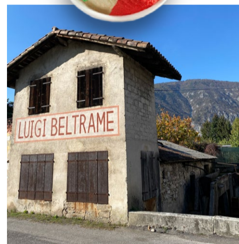
Een van de oudste smederijen in Maniago