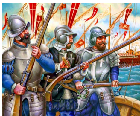
De Venetianen hadden wapentuig nodig voor de oorlogen

Waarom is juist hier, in dit stadje van nog net geen 12.000 inwoners in de provincie Pordenone, deze traditie geboren? Maniago ligt aan de grens van de Karnische Alpen.