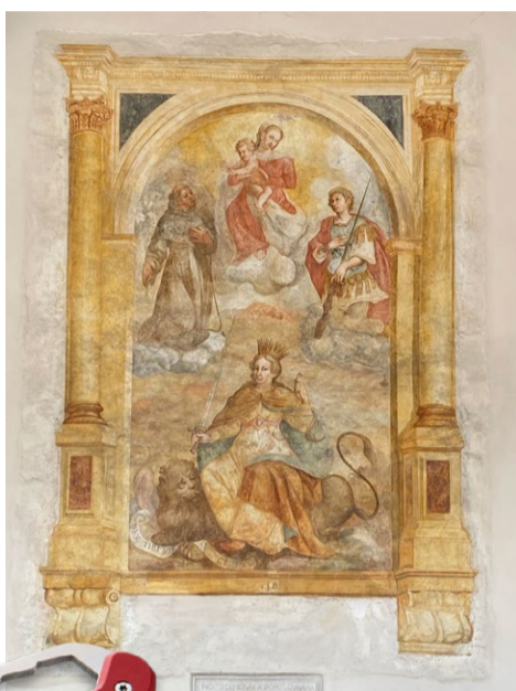
De fresco met vrouw Justitia

BORGO CASTELLO PANICAGLIA BORGO AUTENTICO DEL 1286