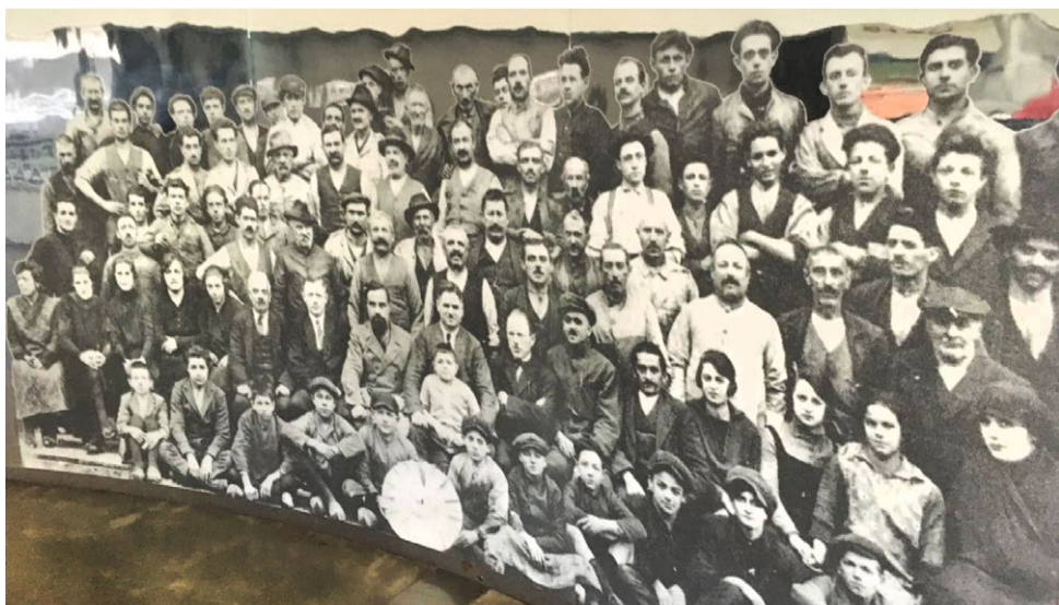
De entree van het MAFC museum