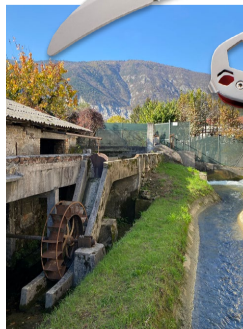
Watermolen langs het riviertje Colvera

De echte omslag voor Maniago begon begin vijftiende eeuw. Toen werd het Friulaanse deel van de regio Friuli Venezia Giulia veroverd door de machtige Republiek van Venetië. De beroemde haven- en handelsstad, voelde zich bedreigd door het Roomse en later Habsburgse Rijk. In deze tijd waren er ook tientallen aanvallen van het gevreesde Ottomaanse leger. De Serenissima had een soort "kussentje" nodig dat Venetië kon beschermen tegen deze oprukkende en op macht beluste volken. De vele bossen in Friuli waren een extra voordeel. Via de talrijke rivieren die uitmondten in de Venetiaanse lagune, werden de boomstammen afkomstig uit de Karnische (voor) alpen naar Venetië getransporteerd. Die werden onder andere voor de befaamde zeevloot ge-