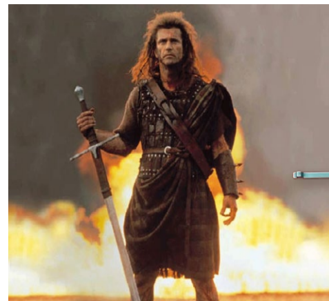
Braveheart met zwaard uit Maniago

In het centrum van Maniago zie je onder de Loggia van het oude gerechtshof een prachtige fresco. Vrouwe Justitia zit op een leeuw (het symbool van Venetië) en houdt in haar ene hand een weegschaal vast, en in haar andere